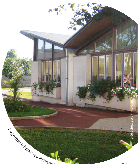
Logement-foyer les Primevères, Beaune (Côte-d'Or)

_ Les logements sont des T1 ou des T2 pour les couples avec une entrée indépendante, une petite cuisine et une terrasse. Des places de parking sont proposées. Les logements sont aménagés et meublés librement par les personnes retraitées. Elles peuvent y recevoir leurs proches et amener leur animal de compagnie.